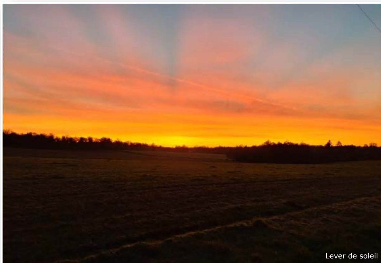
Lever de soleil